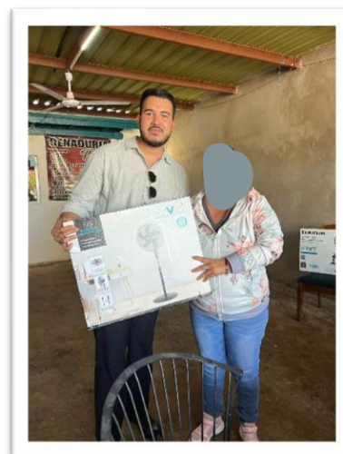
ENTREGA DE ABANICOS, REUNIÓN VECINAL EN COLONIA LOS ARCOS. 09 DE ABRIL 2025.