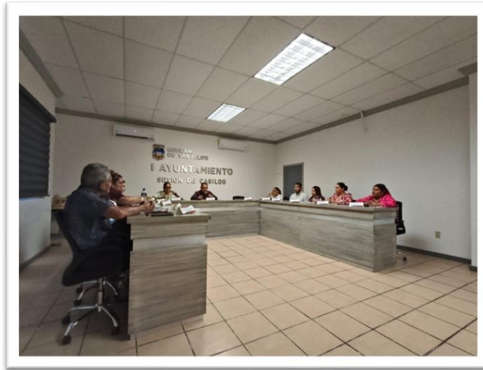
VIGESIMA PRIMERA SESION DE CARÁCTER ORDINARIO. 15 DE MAYO DE 2025.