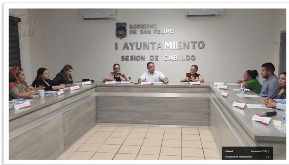
VIGESIMA SEGUNDA SESION EXTRAORDINARIA DE CABILDO PARA LA AUTORIZACIÓN DE CAMBIO DE DIRECTOR DE SEGURIDAD PUBLICA MUNICIPAL. 02 DE JUNIO DE 2025