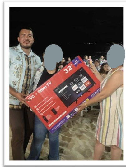
ENTREGA DE ARTICULOS ELECTRONICOS PARA LA CELEBRACIÓN DEL DÍA DE LAS MADRES. 9 DE MAYO DE 2025.