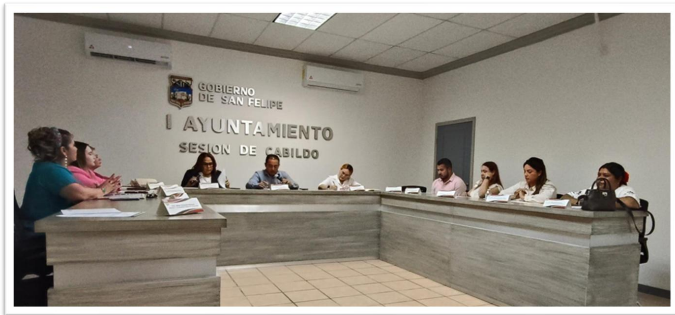
VIGESIMA SESION EXTRAORDINARIA DE CABILDO. 27 DE ABRIL 2025.