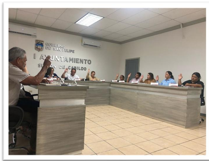
DECIMO NOVENA SESION EXTRAORDINARIA DE CABILDO. 23 DE ABRIL 2025.